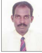
MR. T. STEPHEN Production